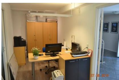
Det nye kontor / vagtværelse område placeret lige midt i hjertet af Granlund