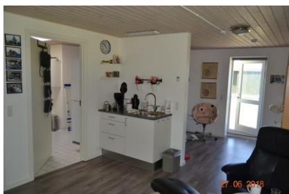
Betinas nye lejlighed