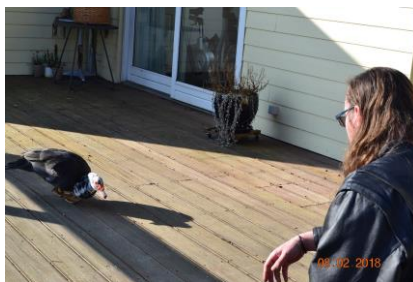
En ekstra logerende på Granlund i en måneds tid inden vi fandt rette ejer