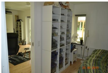
Svends nye lejlighed