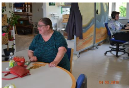
Betina til Banko hver anden fredag ☺