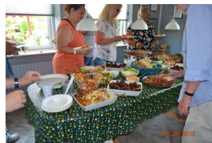
Maden var som vanligt i top