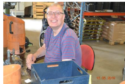
Johns ynglings plads