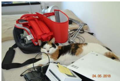
Olle lige midt i flytte rodet